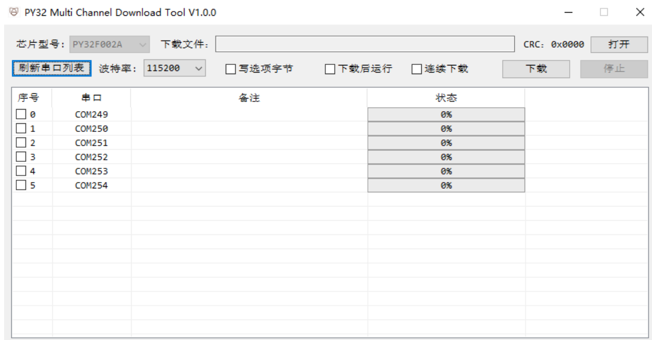
图 2-1. PY32MCDT 主界面

此软件为绿色免安装软件，解压后双击 PY32MCDT_x64.exe 或 PY32MCDT_x86.exe 即可使用。